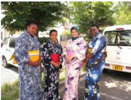
En vestimenta tradicional japonesa

JICA alienta los intercambios internacionales entre los participantes del curso y las comunidades locales. Se solicita a los participantes que traigan, para presentar su país, indumentarias tradicionales y material visual de apoyo como presentaciones en PowerPoint, videos o fotografías.