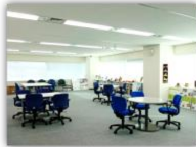
JICA Plaza Tohoku