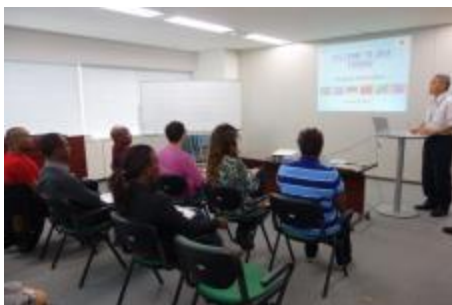
Orientación del programa