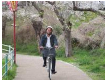
Ciclismo bajo las flores de cerezo