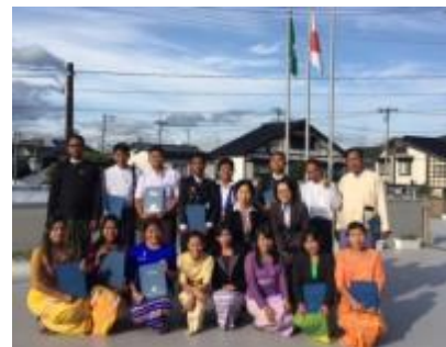
Ceremonia de cierre