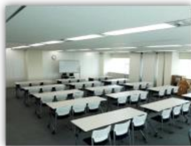
Sala de conferencias