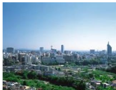
Ciudad de Sendai