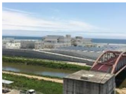
Planta de Tratamiento de Aguas Residuales de Minami Gamo