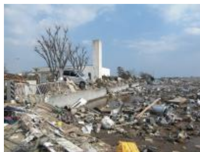
Daños del tsunami